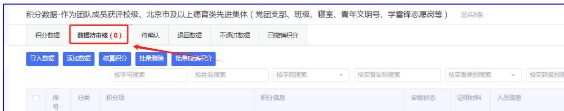
图 6 查看数据