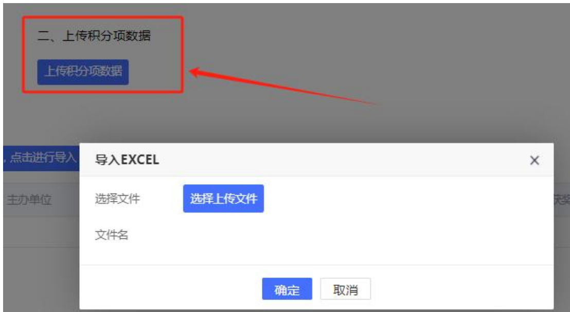
图 12 上传模板