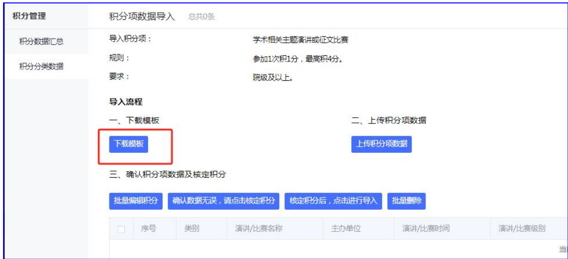
图 10 下载模板