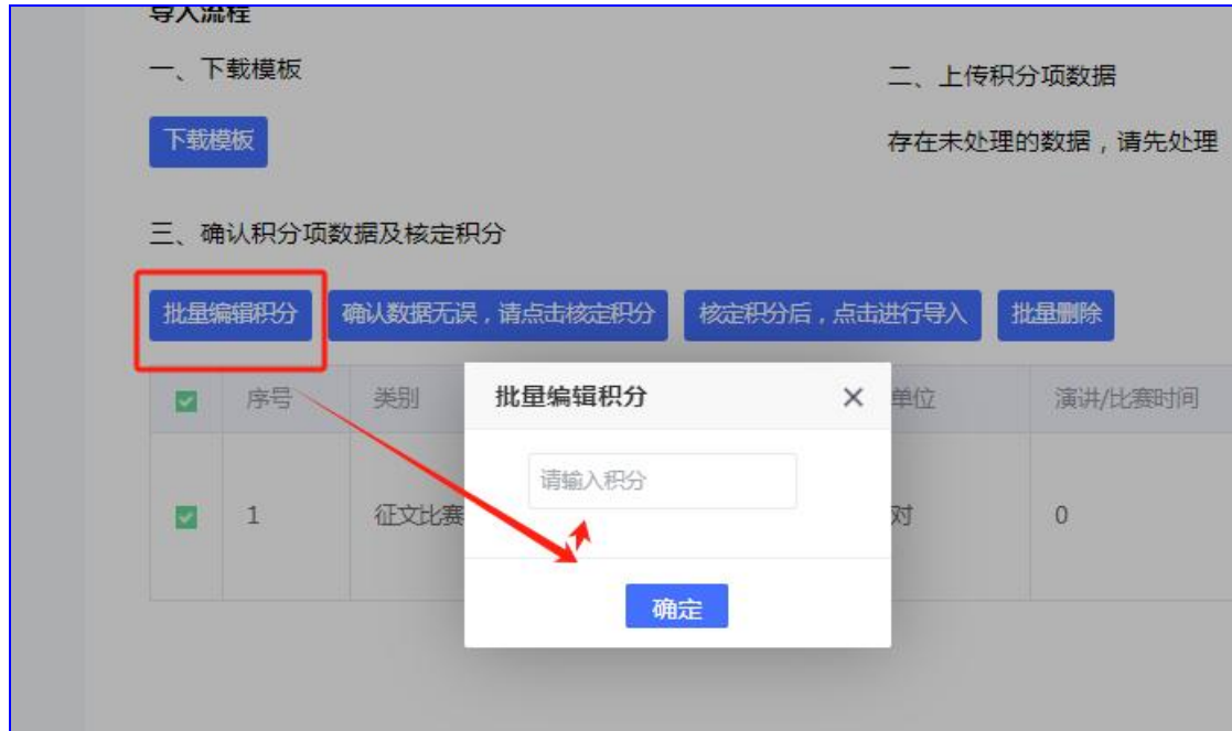
图 13 编辑积分