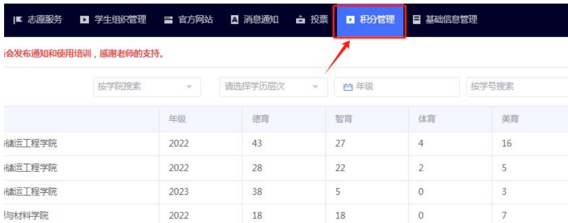
图 2 积分管理系统