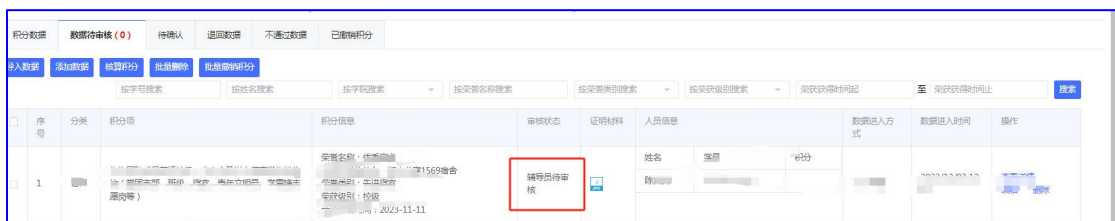
图 7 查看数据待审核状态