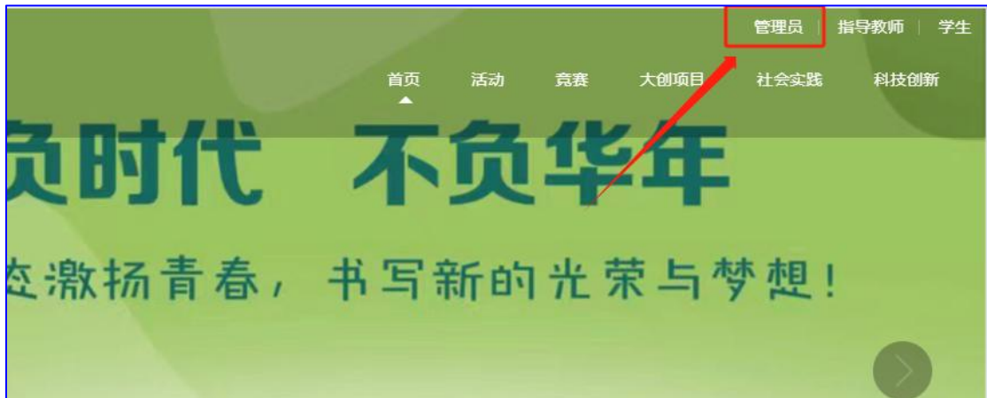
图 1 登录系统

第一步：点击官网右上角【管理员】角色登录。输入账号密码进入后台。如图 1 所示。