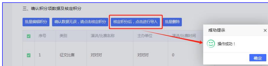
图 15 导入积分