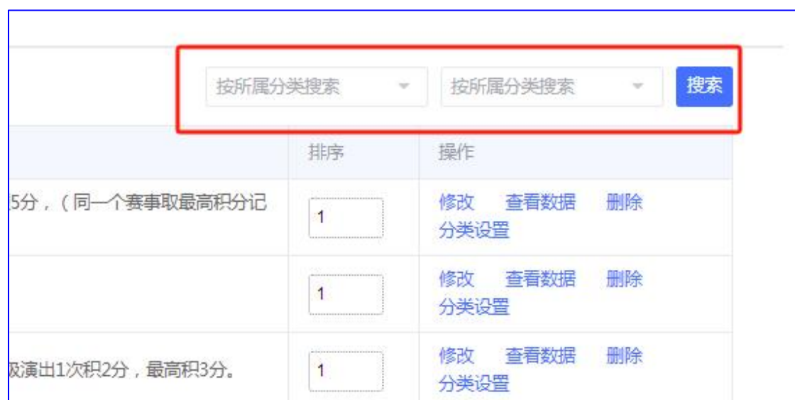
图 4 查看数据