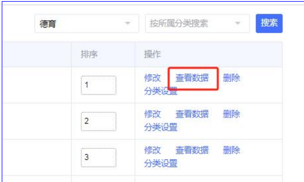
图 5 查看数据