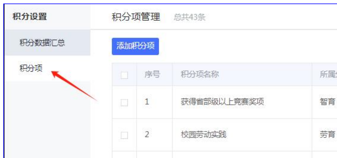
图 3 点击积分项